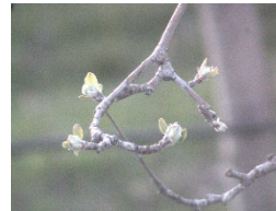
St-Bruno, 26 avril

Selon les modèles prévisionnels, le débourrement avancé (étalement de 2 à 3 feuilles de 5 à 10 mm, d'autres feuilles sont visibles mais non déployées. Souvent nommé stade "oreilles de souris") est atteint sur les sites les plus chauds et devrait l'être au cours de la fin de semaine pour les autres.