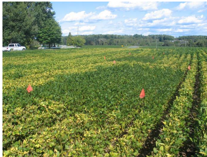
Champ de soya fortement carencé en K. Les parcelles délimitées par des drapeaux ont reçu 100 kg de K_2O /ha sous forme de muriate de potasse à la volée, le 1 er août 2006. La photo a été prise le 23 août 2006.