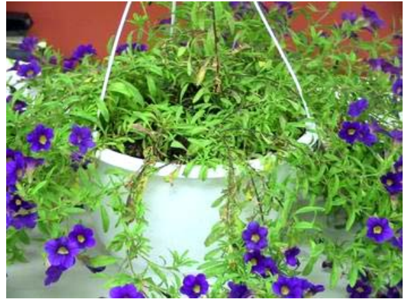
Photos 7-8 : TMV-ToMV sur Calibrachoa ; les paniers se dégarnissent car les feuilles sèchent