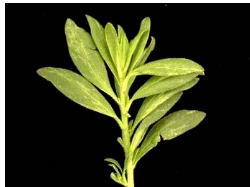
Photos 9-10 : CbMV sur Calibrachoa : feuilles tachetées ou marbrées avec des tons de vert et de jaune clair