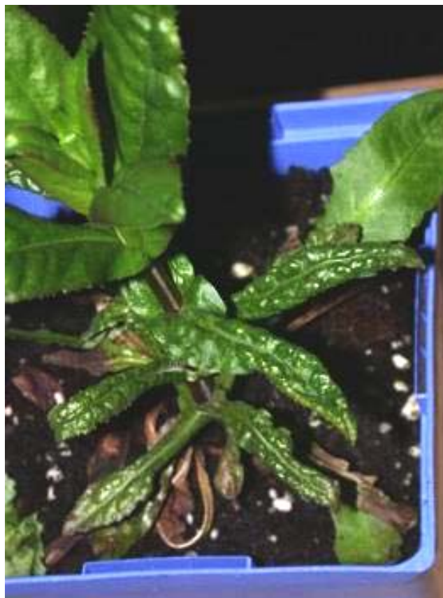
Photo : Gaufrage, réduction et étirement des feuilles.