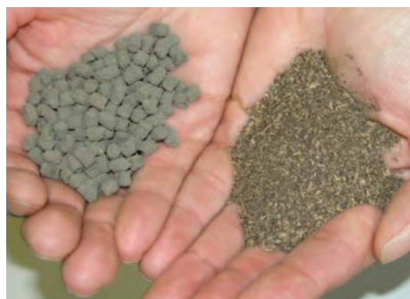
Produit final séché et hygiénisé