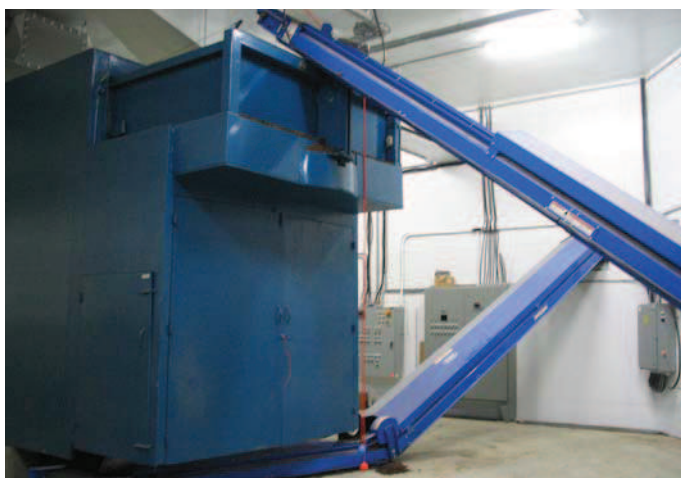
Installation pilote d'un bioséchoir de 50 m 3 (F. Ménard inc.)