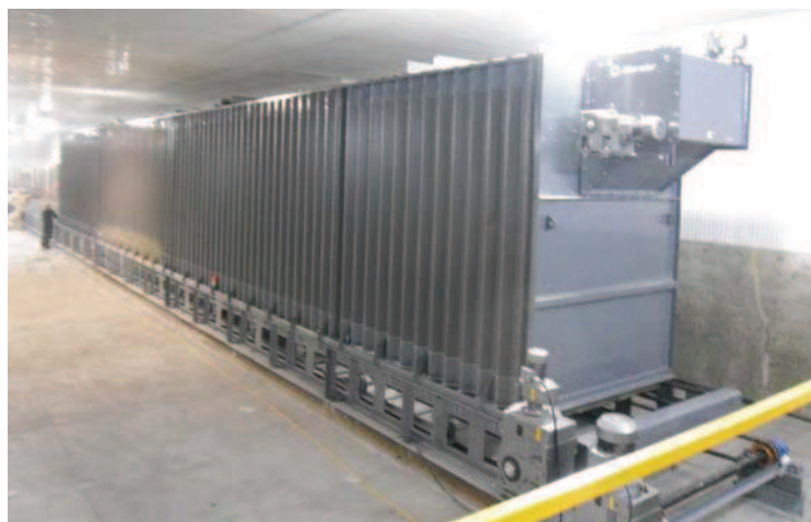
Installation d'un bioséchoir de 220 m 3 (Innoventé inc.)

Les matières utilisées dans le procédé sont des boues ayant entre 13 et 35 % de matière sèche. Au besoin, ces boues sont mélangées avec d'autres résidus organiques qui peuvent avoir aussi un rôle de structurant qui augmente leur perméabilité à l'air et leur taux de matière sèche. Ce mélange entre dans le bioséchoir, où il séjourne pendant 7 à 12 jours, selon le matériel