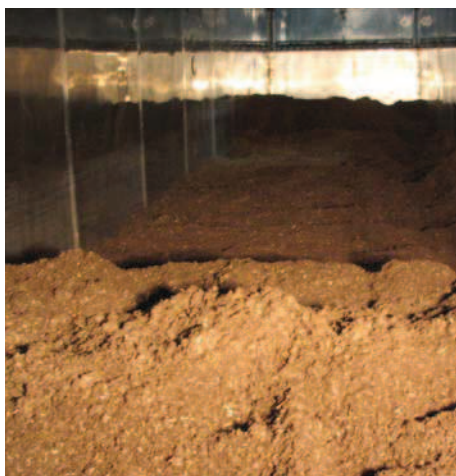
Intérieur d'un bioséchoir de 50 m 3 (F. Ménard inc.)

Le bioséchoir est le cœur du procédé. Il exploite la chaleur dégagée par les bactéries lors de l'activité aérobie en phase thermophile pour accélérer l'évaporation de l'eau contenue dans les boues à traiter. Un système d'aération forcée en régime contrôlé permet d'évacuer l'eau sans générer de lixiviat. L'énergie contenue dans l'air chaud et humide évacué du bioséchoir est alors récupérée grâce à des échangeurs d'air récupérateurs de chaleur. L'énergie récupérée servira à finaliser le séchage du matériel sur le séchoir à bandes.