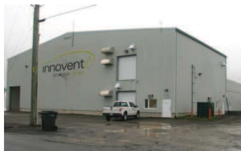
Usine de l'entreprise Innoventé de Saint-Patrice-de-Beaurivage