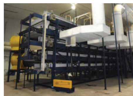
Installation d'un séchoir final (Innoventé inc.)

à traiter et le niveau d'assèchement désiré. Ensuite, le matériel est extrait à la base du bioséchoir et dirigé sur un séchoir à bandes. Lorsque le matériel atteint l'assèchement désiré, il peut être transformé en granules qui, selon les besoins, serviront d'amendement organique, de biocombustible dans des systèmes de cogénération ou de matière pyrolytique.