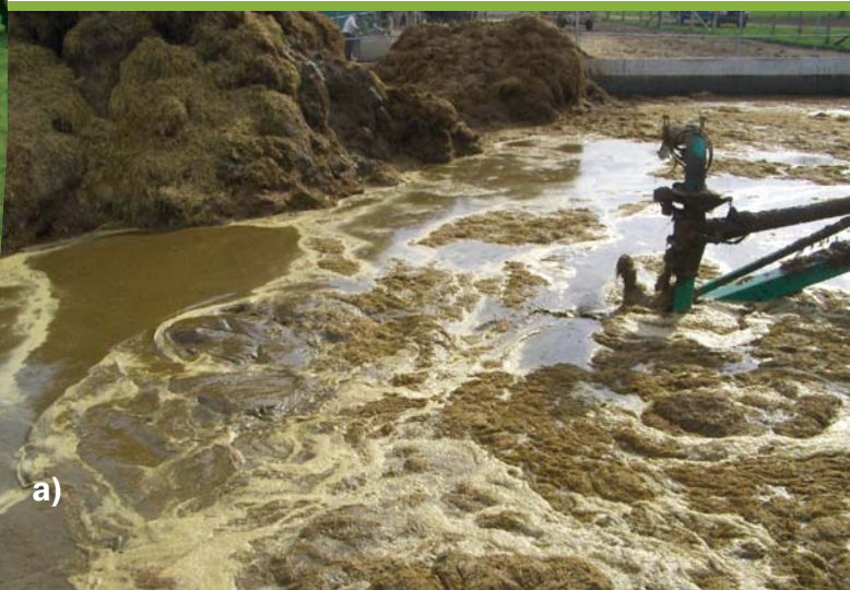
Figure 5 : Pailles flottant à la surface d'un lisier clair. a) dans la fosse; b) dans la citerne d'épandage.

Les producteurs qui ne disposent pas de l'équipement nécessaire pour réaliser un bon brassage peuvent envisager diverses formules de partage de machinerie, ou engager des entreprises d'épandage à forfait.