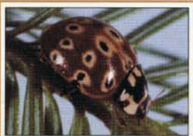
SCF : T. Arcand