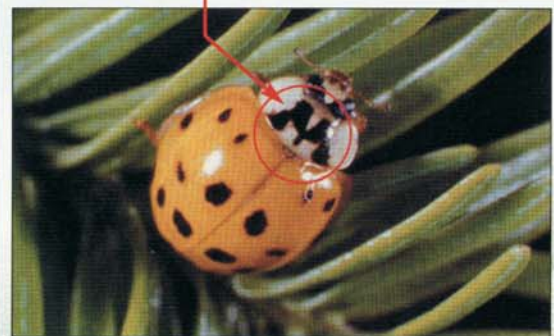
Coccinelle asiatique avec des points.

La coccinelle asiatique ( Harmonia axyridis Pallas.) est un coléoptère qui mesure environ 6,5 mm de longueur. Elle est l'une des plus grosses espèces de coccinelle qu'il est possible d'observer au Québec. À l'état adulte, la coccinelle asiatique peut avoir plusieurs patrons de coloration différents, et ce, au sein d'une même population. Au Québec, la coloration des ailes peut varier entre le jaune et le rouge en passant par toutes les teintes imaginables d'orangé. De plus, le nombre et la forme des taches noires présentes sur les ailes sont également fort variables. Cependant, le thorax de cette coccinelle est pâle et possède une tache en forme de « M » qui est caractéristique de cette espèce.