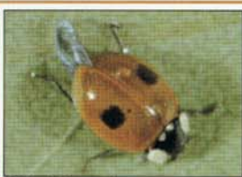
SCF : T. Arcand