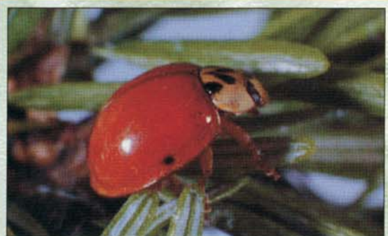
Coccinelle asiatique complètement orangée.