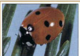
SCF : T. Arcand