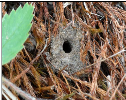
Photo : 5. Melitta americana (Mélittides) – Entrée d'un nid dans une bordure sablonneuse à végétation éparse. (photo : André Payette, Canneberges des Cyprès, 6 juillet 2012).