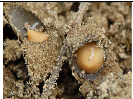
Photo : 6. Melitta americana (Mélittides) – Jeunes larves s'alimentant sur des masses de pollen pur à 100% de la canneberge à gros fruits, V. macrocarpon . (photo : André Payette, Canneberges des Cyprès, 6 juillet 2012).

Bombus ternarius (Apides) – Ouvrière butinant sur l'épilobe à feuilles étroites, Chamerion angustifolium . (photo : André Payette, Canneberges des Cyprès, 7 juillet 2005).