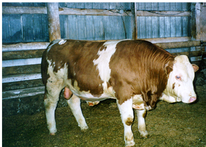
Taureau de la station de Saint-Martin

Pour les résultats 1997, une grille d'évaluation a servi à noter les performances de chaque entre-