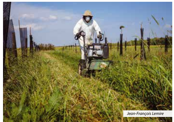
Débroussailluse à traction Billy goat dans un témoin forestier de 5 lignes d'arbres

L'espace de 36 m entre les rangées du SAI a été choisi pour faciliter le passage de la machinerie associée aux grandes cultures. Cet espacement combiné à des travaux d'élagage et de taille de formation des arbres permet d'offrir des conditions de lumière adéquate pour les cultures adjacentes. La faible superficie agricole est compensée par les avantages fournis par les arbres tels l'effet brise-vent et un microclimat favorable pour les rendements à la parcelle.