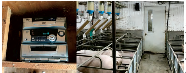
Une radio installée dans le bureau de la ferme. Des enceintes sont fixées dans les chambres.

Pour les truies et les cochettes en gestation ou en mise-bas, beaucoup d'éleveurs ont installé des radios. La plupart du temps, la radio se trouve dans le bureau de la ferme, et des enceintes acoustiques sont installées dans les chambres. Certains producteurs ont également recouvert les radios, par exemple, avec une poche de moule pour empêcher la poussière de les endommager.