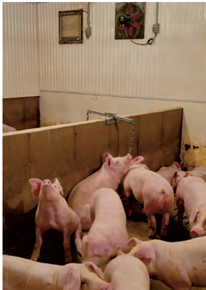
La chaîne est aussi utilisée par les porcelets.