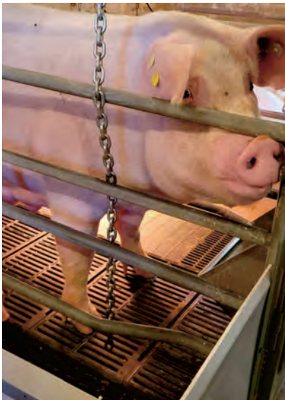
La chaîne est fixée à l'un des barreaux de la cage.

Dans les parcs en groupe, il est aussi possible de l'attacher directement au plafond ou bien sur une séparation de parc. Les vieilles chaînes à pastille peuvent être aussi récupérées, nettoyées et utilisées au lieu d'acheter de nouvelles chaînes. Rien de mieux que donner une deuxième vie à un objet.