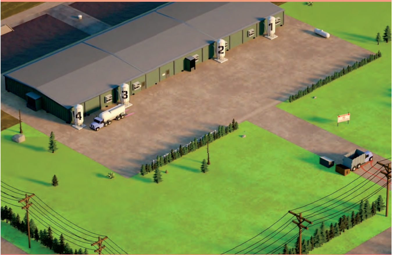
Photo tirée de la capsule sur La Zone d'accès contrôlé.

En décembre 2019, le Conseil canadien du porc a mis en branle un grand projet national visant le développement d'outils de formation pour l'ensemble des éleveurs canadiens.