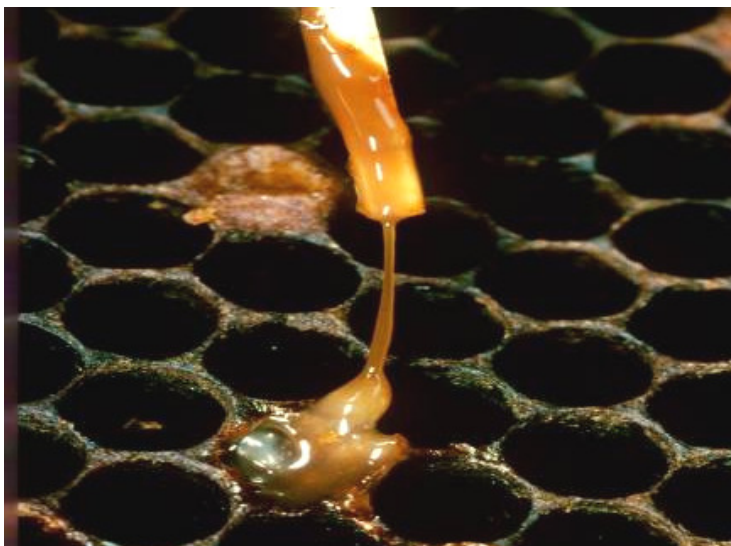
Photo 3 : Résultat positif du test du cure-dent dans une cellule atteinte de la loque américaine.