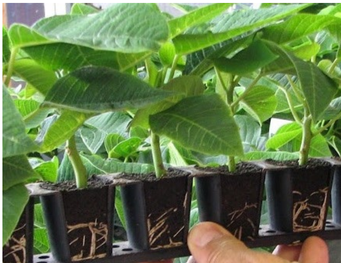
Boutures enracinées de poinsettia ( Euphorbia pulcherrima )

Le poinsettia est sujet à la phytotoxicité. Il est recommandé d'utiliser la plus faible dose de l'étiquette des produits homologués pour le trempage de cette plante. D'ailleurs, certaines étiquettes donnent des recommandations spécifiques au traitement des poinsettias. Pour l'emploi du LANDSCAPE OIL, l'étiquette indique de submerger les boutures de variétés sensibles comme le poinsettia dans l'eau, après le traitement par trempage, pour enlever l'excédent d'huile. Pour l'emploi du SUFFOIL-X sur le poinsettia, l'étiquette précise d'utiliser la dose minimale, soit 1 ml/l. Cette dose peut d'ailleurs être utilisée pour l'ensemble des espèces traitées par trempage avec ce produit, pour prévenir la toxicité.