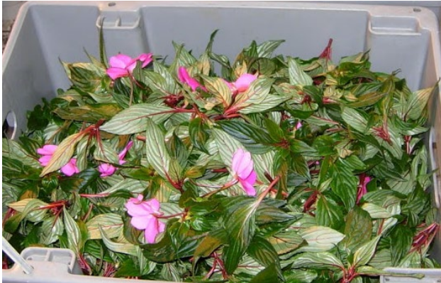
Boutures non enracinées en vrac

On peut aussi utiliser un sac en filet pour immerger les boutures ou encore les baigner « en vrac » dans le bac de solution.