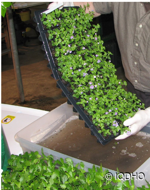
Trempage de boutures enracinées

En premier lieu, vérifier si l'homologation du produit choisi permet le trempage de ce type de boutures.