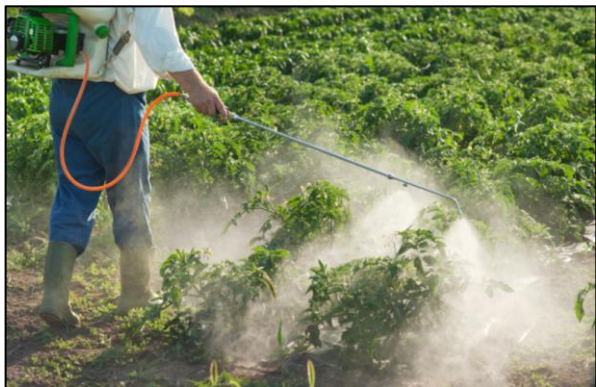
Désherbeur à la vapeur

❖ Équipements de désherbage thermique ou électrique