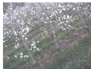
St-Bruno, 16 mai 2025, 6h