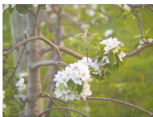
Frelighsburg, 16 mai 2025, 6h

La floraison bat son plein et un tapis blanc commence à recouvrir le sol, à plusieurs endroits.. Soyez prêt à intervenir pour plusieurs situations : éclaircissage, blanc, brûlure bactérienne, tavelure.