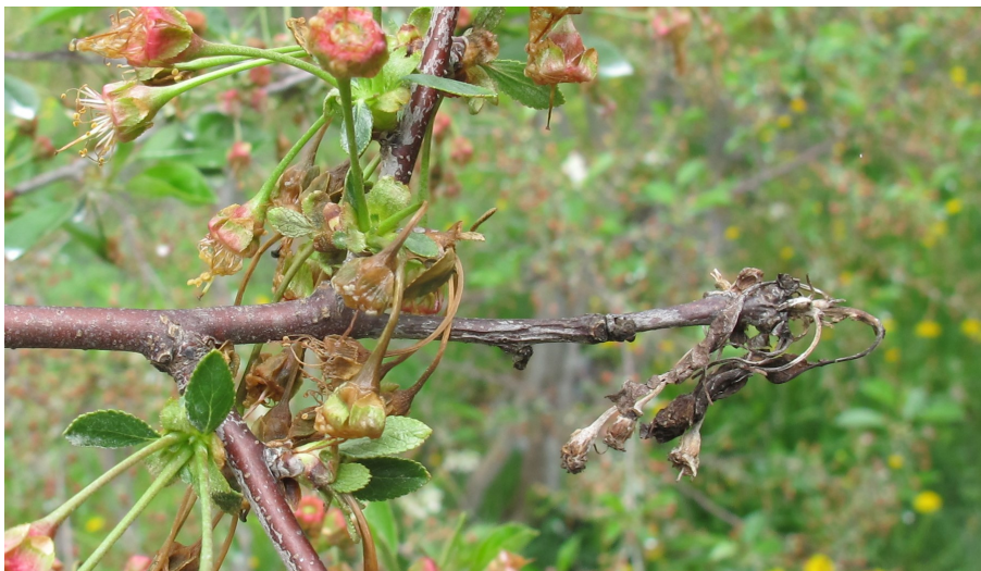
Brunissement des fleurs de l'année en cours et présence en bout de tige de feuilles et de fleurs infectées l'année précédente

L'infection s'étend ensuite aux tiges de l'année et parfois aux fruits verts.