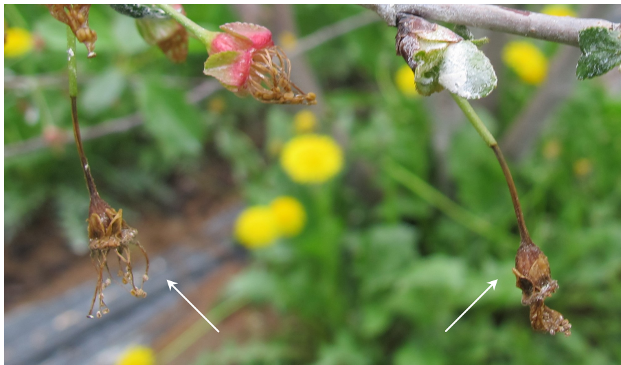
Premiers symptômes de brûlure des fleurs

À l'occasion, un duvet brun-grisâtre se développe à la surface des fleurs et des tiges infectées.