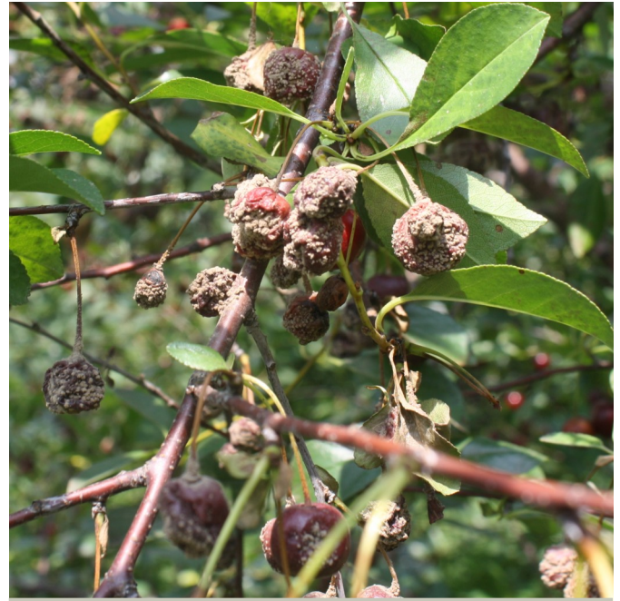
Perte de récolte causée par la pourriture brune sur des fruits dans un verger non traité

Ce champignon peut affecter tous les fruits à noyau, dont les cerises douces et acides de même que les pêches, les nectarines, les abricots et les prunes.