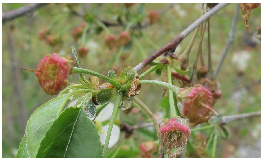
Chancre sur une tige

Le chancre causé par la pourriture brune ceinture la tige et provoque le flétrissement des feuilles terminales, qui brunissent, mais demeurent attachées à la tige. Généralement, les chancres se trouvent seulement sur les nouvelles tiges et non sur les tiges âgées d'un an ou plus.