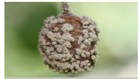
Duvet beige causé par la pourriture brune sur un fruit

Une partie des fruits infectés tombe au sol. Toutefois, plusieurs fruits infectés, qu'ils soient immatures ou matures, restent attachés à l'arbuste. En effet, les tissus en décomposition forment une toxine qui cause un dépérissement de la tige et qui empêche ainsi le fruit de se détacher du pédoncule. Ces fruits infectés se momifient et restent accrochés dans l'arbre.