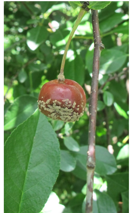
Cerise atteinte de pourriture brune.

Une fois les fleurs infectées, la maladie se multiplie rapidement au cours de l'été si la température et les précipitations lui sont favorables, et aussi longtemps qu'il y a des fruits mûrs sur les plants. Il s'agit des infections secondaires, qui provoquent la pourriture des fruits.