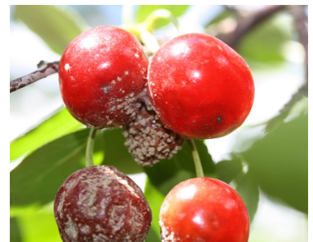
Dispersion de la pourriture brune sur des fruits avoisinants