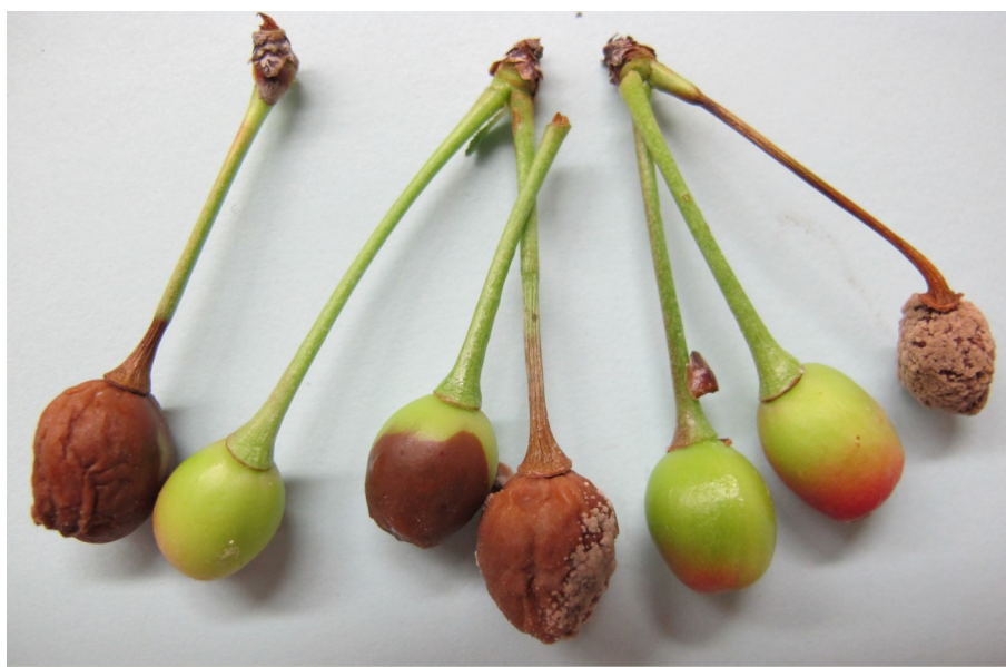
Fruits verts infectés par la pourriture brune

Le fruit nouvellement formé, dont le noyau est encore mou, peut être infecté : il devient brun et se couvre de duvet beige. Le fruit résiste aux infections lorsque son noyau commence à durcir puis il redevient sensible lors du mûrissement, soit de une à trois semaines avant la récolte.