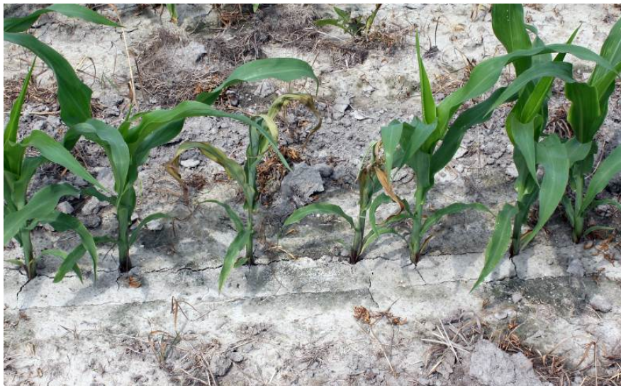
Photo 7 : Flétrissement de la tête des plants (dead heart) causé par des larves de ver-gris noir

Lorsque le maïs atteint les stades 4 à 5 feuilles, les larves ne parviennent pas toujours à couper le plant complètement. Les plus grosses larves réussissent toutefois à transpercer la tige sous la surface du sol, ce qui provoque un flétrissement de la tête du plant appelé « dead heart » (photos 7 et 8). Il y a un risque de dommages lorsque la date d'apparition des stades larvaires qui coupent les plants coïncide avec la période où les plantes sont encore assez petites pour être coupées. Les risques de dommages dans le maïs sont les plus élevés lorsque les populations de larves sont au stade 4 ou plus, en même temps que le maïs est au stade 5 feuilles ou moins.