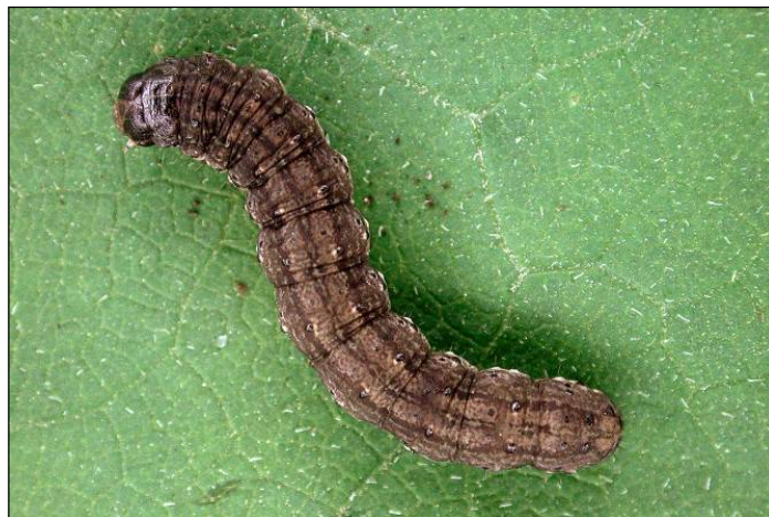
Photo 2 : Larve du ver-gris noir