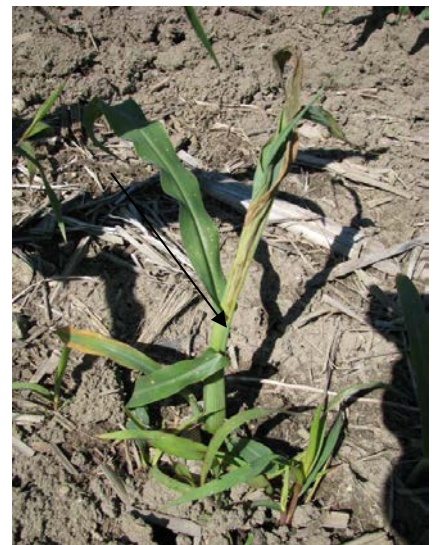
Photo 8 : Flétrissement de la tête d'un plant (dead heart) causé par une larve de ver-gris noir