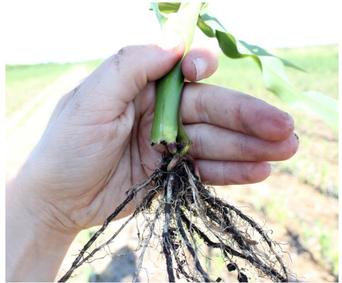
Photo 6 : Plant de maïs coupé par une larve de ver-gris noir

Lorsque le maïs atteint les stades 4 à 5 feuilles, les larves ne parviennent pas toujours à couper le plant complètement. Les plus grosses larves réussissent toutefois à transpercer la tige sous la surface du sol, ce qui provoque un flétrissement de la tête du plant appelé « dead heart » (photos 7 et 8). Il y a un risque de dommages lorsque la date d'apparition des stades larvaires qui coupent les plants coïncide avec la période où les plantes sont encore assez petites pour être coupées. Les risques de dommages dans le maïs sont les plus élevés lorsque les populations de larves sont au stade 4 ou plus, en même temps que le maïs est au stade 5 feuilles ou moins.