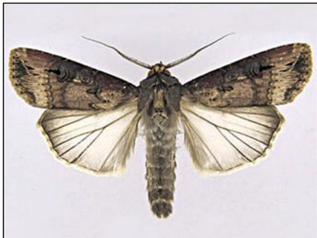
Photo 1 : Adulte (papillon) du ver-gris noir

L'adulte est un papillon nocturne de 42 à 55 mm d'envergure, ses ailes antérieures sont de brun pâle à brun foncé et ses ailes postérieures sont gris pâle avec des nervures brunes (photo 1). La couleur des larves varie du gris cendré au noir et elles sont dotées de petits tubercules convexes (visibles à la loupe) leur donnant un aspect granuleux (photo 2). Leur tête est foncée, séparée en son centre par une ligne pâle (photo 3).