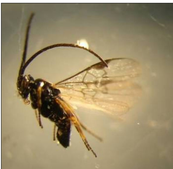
Photo 9 : Guêpe parasitoïde ( Braconidae )

Plusieurs insectes bénéfiques peuvent contribuer à réduire les populations de ver-gris noir dans les champs, comme des guêpes parasitoïdes (photo 9) ou des carabes prédateurs (photo 10). L'aménagement de bordures enherbées ou boisées autour de la ferme favorisera les carabes, tandis que la présence de fleurs en bordure permettra aux parasitoïdes de se nourrir de nectar et de pollen avant de pondre leurs œufs sur les larves de ver-gris noir.