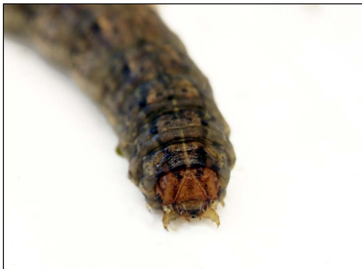
Photo 3 : Tête de la larve du ver-gris noir