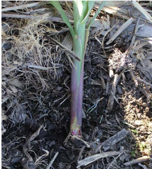
Photo 5 : Plant de maïs coupé par une larve de ver-gris noir