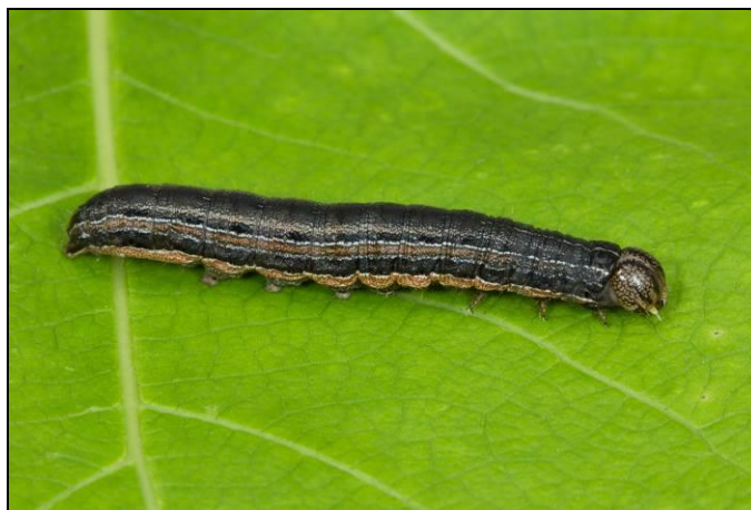
Figure 2 : Larve et ses patrons de couleur