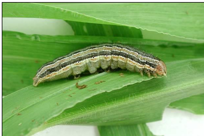
Figure 1 : Larve et ses patrons de couleur