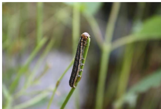
Figure 6 : Larves ayant coupé la base d'un épi de graminée