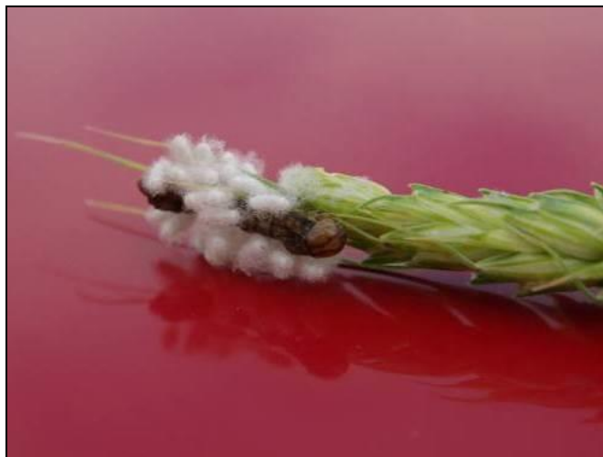
Figure 7 : Larve envahie par des cocons de parasitoïdes