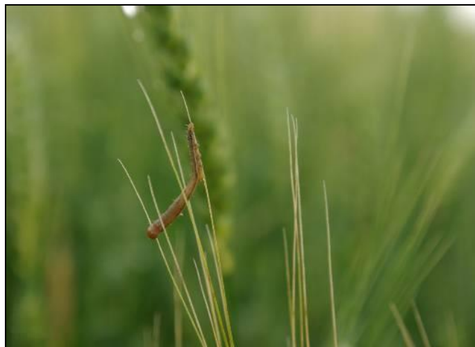
Figure 8 : Larve infectée par un pathogène