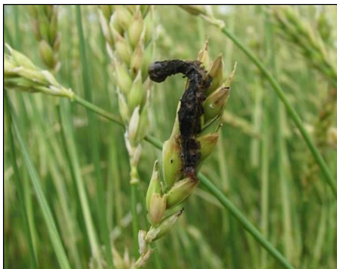
Figure 9 : Larve tuée par des pathogènes