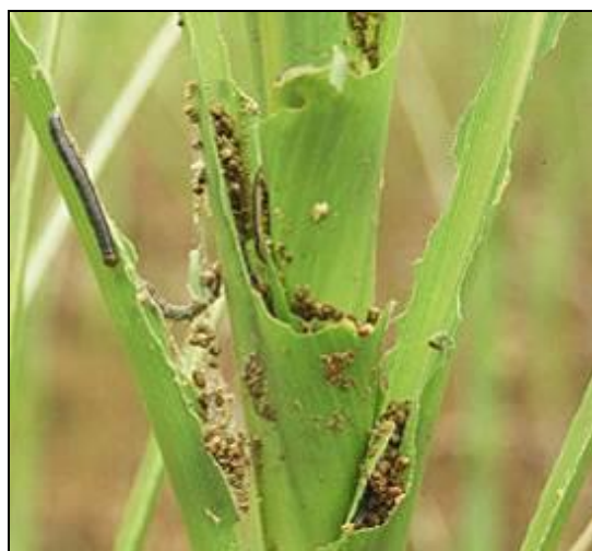
Figure 4 : Larves et leurs excréments