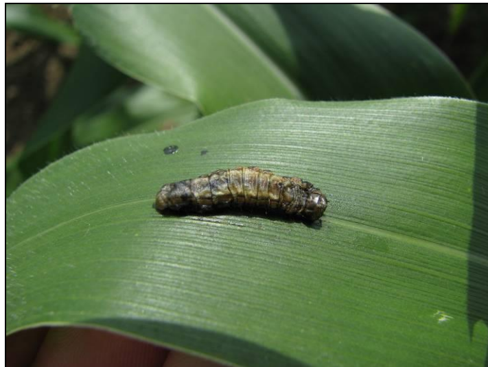
Figure 10 : Larve tuée par des pathogènes