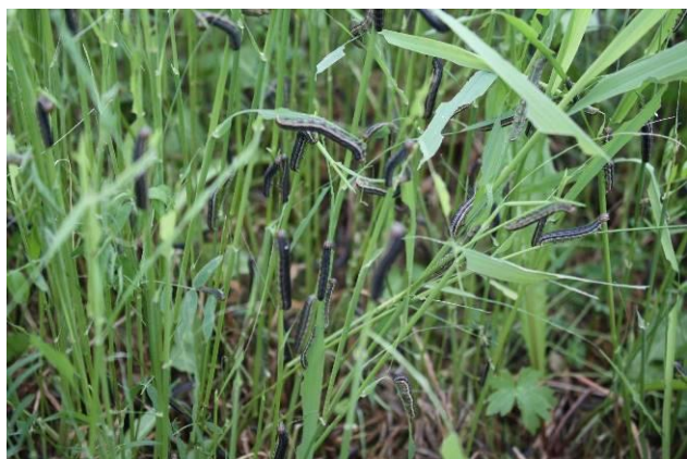
Figure 5 : Larves dévorant une prairie de graminées