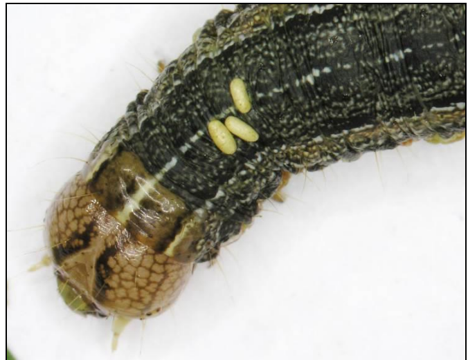
Figure 6 : Larve parasitée par des œufs de mouche