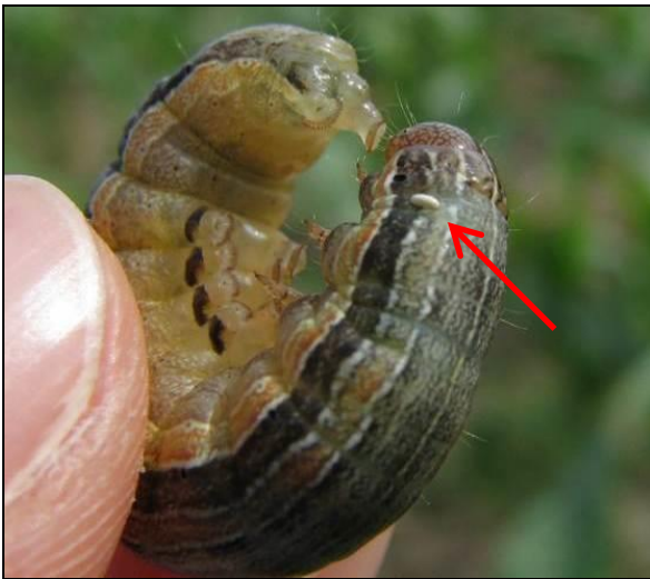
Figure 5 : Larve parasitée par un œuf de mouche