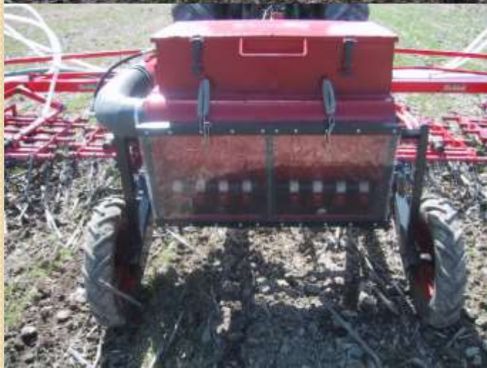
Peigne et semoir combiné