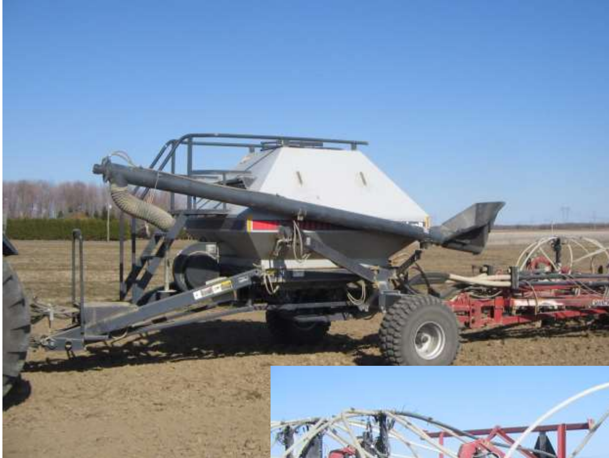
Semoir à deux compartiments