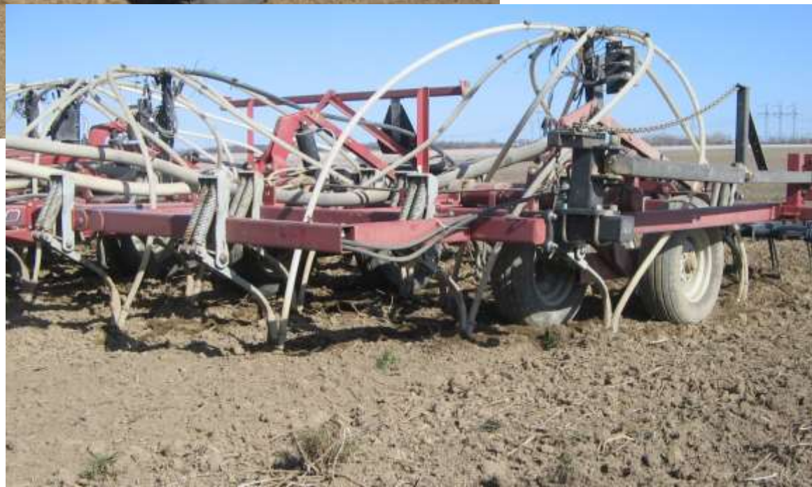
Semis sous les pattes d'oies