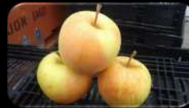
Delcorf x Cortland (hyb. 2003)