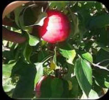
Honeycrisp x Pitchounette (hyb. 2007)

Création variétale : Les variétés de la Pomme de Demain