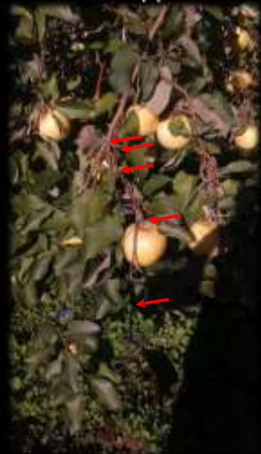
GS x Melba