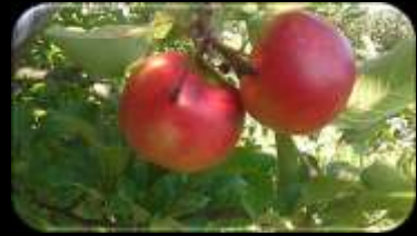
Honeycrisp x Pitchounette (hyb. 2007)