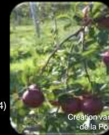
Création variétale : Les variétés de la Pomme de Demain