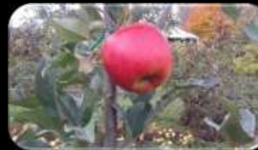
Delcorf x Cortland (hyb. 2003)