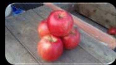
NJ75 x Cortland (hyb. 2003)