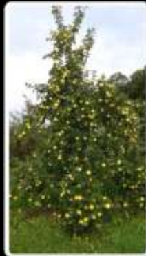
Création variétale : Les variétés de la Pomme de Demain