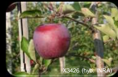
X3426 (hyb. INRA)