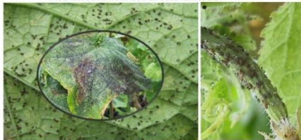
La lutte bio avec prédateurs voraces et Aphidius