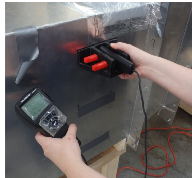
Vérification des données (gauche).

« Les compagnies de systèmes de filtration conseillent aux producteurs de changer les filtres lorsque leur système de ventilation présente une chute de