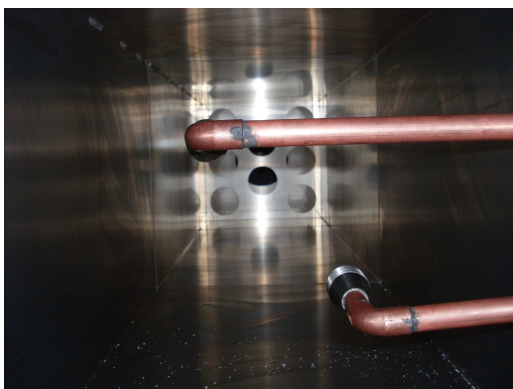
Sondes d'échantillonnage dans la plateforme d'essai.