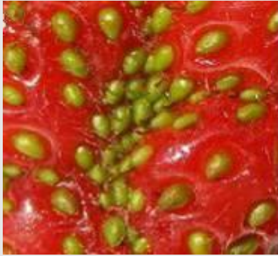
Domage de punaise

La malformation des fraises peut se confondre avec une mauvaise pollinisation. Dans ce dernier cas, on observe de petits akènes à travers de plus gros, tandis que les dégâts de la punaise montrent des akènes de la même grosseur, même s'ils sont regroupés. Le gel partiel des fleurs peut aussi causer des déformations de fruits.