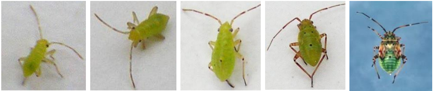
1 er stade larvaire

Il y a 5 stades de développement larvaire. La larve de la punaise terne mesure de 1 à 5 mm de long, est vert jaunâtre et possède une tête triangulaire avec des antennes composées de bandes brun pâle et brun foncé en alternance. Une glande odorante, formant une tache noire sur le haut du 3 e segment abdominal, est visible à partir du 3 e stade. Au 4 e stade, on observe des points noirs sur le dos, et au 5 e stade, les bourgeons alaires.