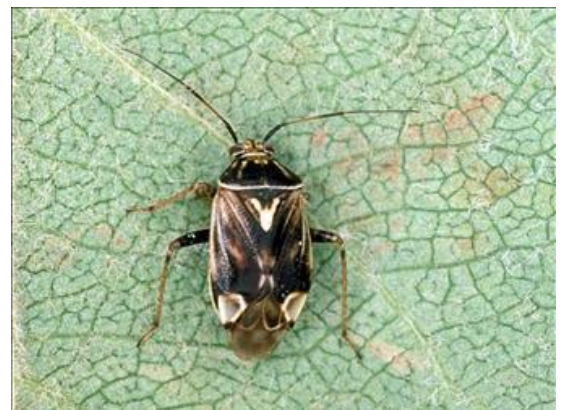
Punaise terne adulte

Hôtes Identification Cycle vital Diète et dispersion Dommages Surveillance phytosanitaire Stratégies d'intervention