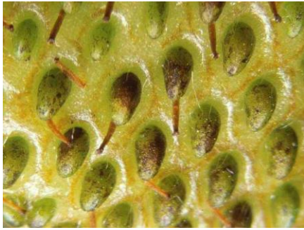
Domages de thrips sous les akènes