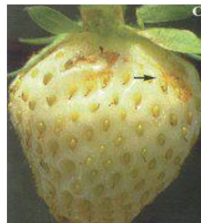
Symptômes de bronzage sous les sépales, à l'abri du soleil