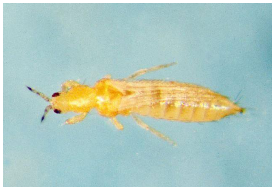
Thrips des fleurs ( Frankliniella tritici )

Attention de ne pas confondre les thrips avec les collemboles qui tombent facilement dans les plats lors des frappes!