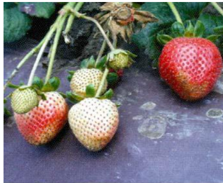
Bronzage associé à de la phytotoxicité ou à du frottement Photo : Koike et collab., 2009

Source : Thibault, P. 2011. Un « thrips » de fraise, Journées horticoles Saint-Rémi