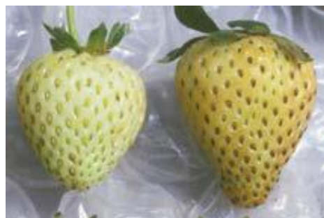
Bronzage associé aux stress climatiques Photo : Koike et collab, 2009

Source : Thibault, P. 2011. Un « thrips » de fraise, Journées horticoles Saint-Rémi