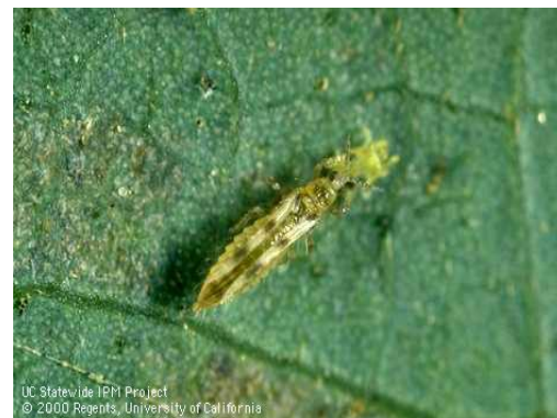
Thrips bénéfique 'six-spotted thrips' Photo : UC IPM, Sixspotted thrips

Source : Lemaire, É., S. Tellier, D. Bergeron et N. Boissinot. 2011. Les thrips et le bronzage sur fraises : état des connaissances