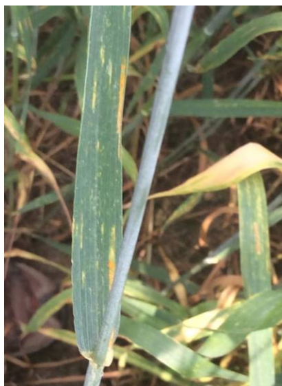
Figure 3 : Lésions allongées avec et sans pustules jaunes sur une feuille de blé d'automne à Saint-Augustin-de-Desmaures en juillet 2014