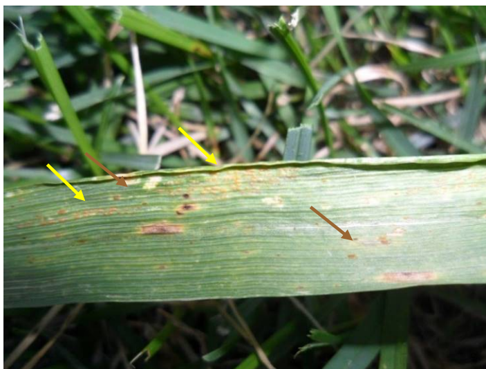
Figure 1 : Première observation de rouille jaune sur du blé de printemps à Saint-Augustin-de-Desmaures en juillet 2013 (flèches jaunes). Quelques pustules de rouille brune sont également présentes (flèches brunes).