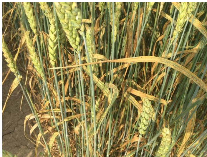
Figure 2 : Plants de blé d'automne fortement infectés par la rouille jaune à Saint-Augustin-de-Desmaures en juillet 2014