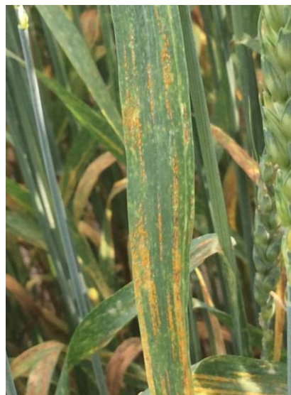
Figure 4 : Pustules jaunes et noires de rouille jaune sur une feuille de blé d'automne à Saint-Augustin-de-Desmaures en juillet 2014

Les urédospores de la rouille jaune ont besoin d'eau libre sur le feuillage (pluie ou rosée) et de températures entre 7 et 12 °C pendant environ 3 heures pour germer et infecter les tissus. Une fois dans la plante, le champignon prend entre 8 et 14 jours à des températures optimales (10 à 15 °C) pour produire d'autres urédospores. À des températures plus élevées (jusqu'à 25 °C) ou plus basses (jusqu'à 0 °C), son développement est plus lent.