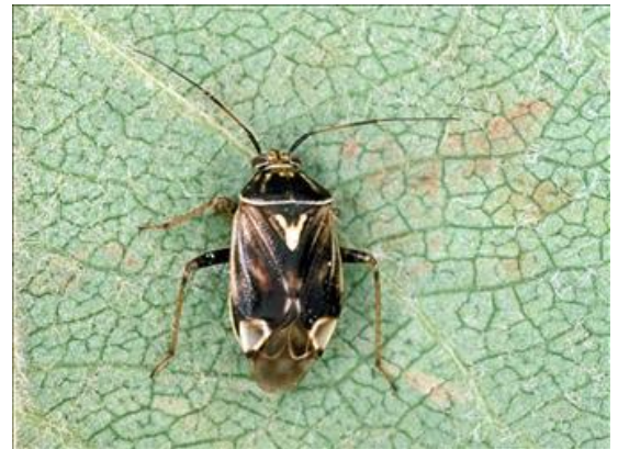
Punaise terne adulte