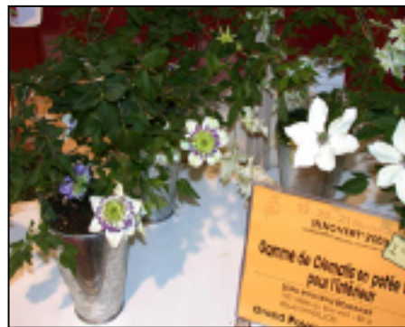
Clématites en potée fleurie