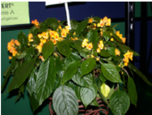
Impatiens auricoma 'Jungle Gold'

L'édition du 13 février 2003 de la revue française Lien Horticole présente un portrait détaillé de l'ensemble des nouveautés présentées au Salon. On peut obtenir des copies en s'adressant directement à la revue Lien Horticole ou en consultant la banque de données Hortidata.