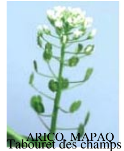
ARICO, MAPAQ Tabouret des champs