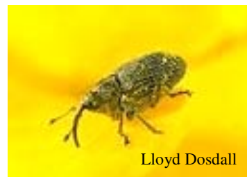
Adulte du charançon de la silique