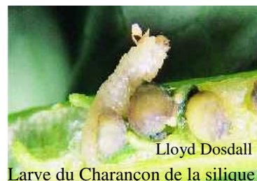
Larve du Charançon de la silique