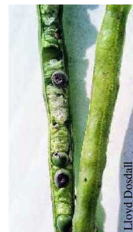
Lloyd Dosdall Dommages causés par le charançon de la silique