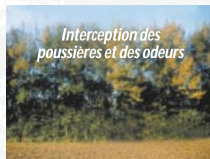
Figure 1 ÉCRAN BOISÉ