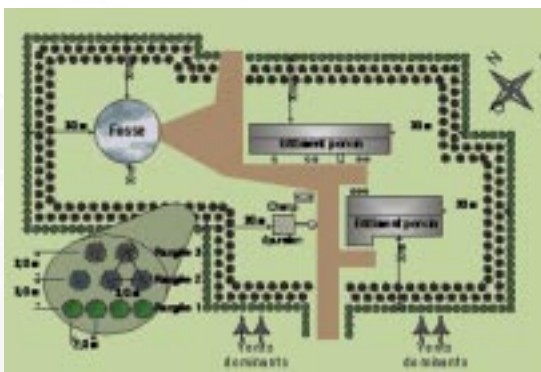
Figure 4 ÉCRAN BOISÉ MODÈLE POUR RÉDUIRE LES ODEURS ÉMANANT DES INSTALLATIONS PORCINES