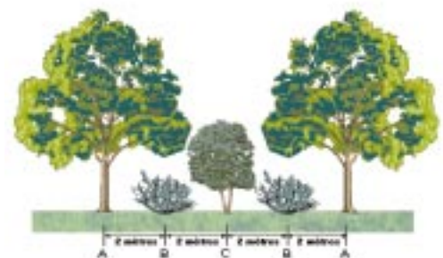
SCHÉMA DE LA RANGÉE DE FEUILLUS NOBLES ET ARBUSTES

Légende: A: arbre, B: arbuste, C: petit arbre