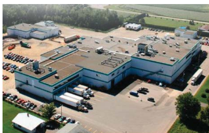
Les propriétaires d'ATRAHAN Transformation inc. sont fiers que leur entreprise se soit classée parmi les 50 sociétés les mieux gérées au Canada, presque à chaque année depuis 2003. Ce succès assure une bonne visibilité à l'entreprise de Yamachiche.