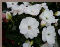
Compact White Improved