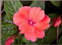
Compact Deep Rose