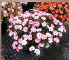
Spreading Pink Flash (Pink Bi-color)