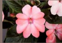
Compact Blush Pink