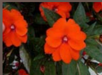
Compact Electric Orange