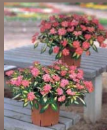
Spreading Salmon (Feuillage panaché)