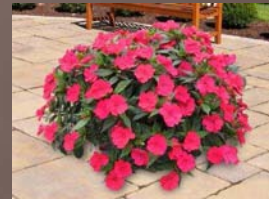
Spreading Carmine Red