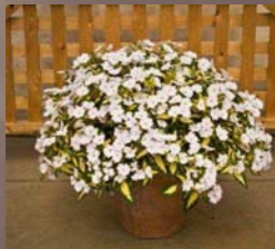
Spreading White (feuillage panaché)