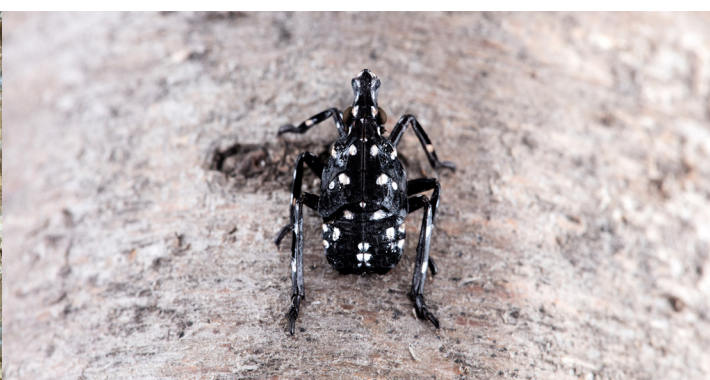
JEUNE LARVE - AVRIL À JUILLET