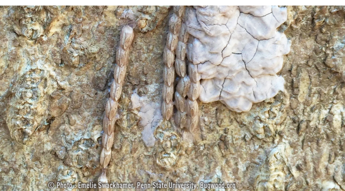
OEufs - SEPTEMBRE À AVRIL

PRENEZ DES PHOTOS OU CAPTUREZ LES SPÉCIMENS SUSPECTS ET SIGNALEZ SA PRÉSENCE AU 418 643-5027 OU AU PHYTOLAB@MAPAQ.GOUV.QC.CA.