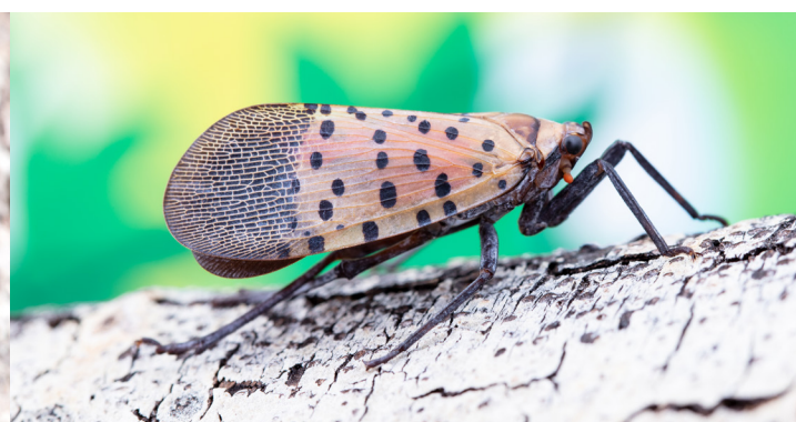
ADULTE - JUILLET À DÉCEMBRE