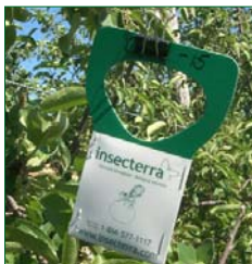
Trichocarte utilisée pour lâcher les trichogrammes