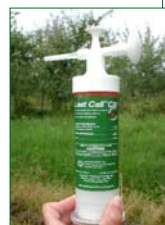
Produit utilisé pour la lutte attracticide