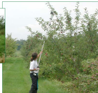
Pose de l'attracticide sur les arbres de plus de 2m